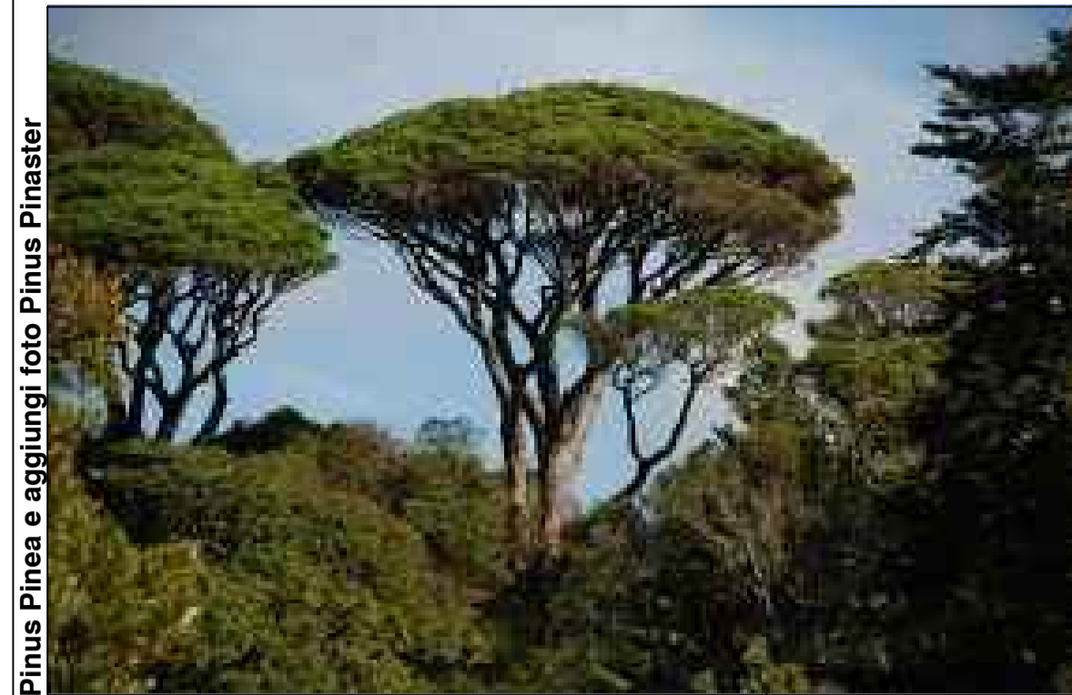
Pinus Pinea e aggiungi foto Pinus Pinaster