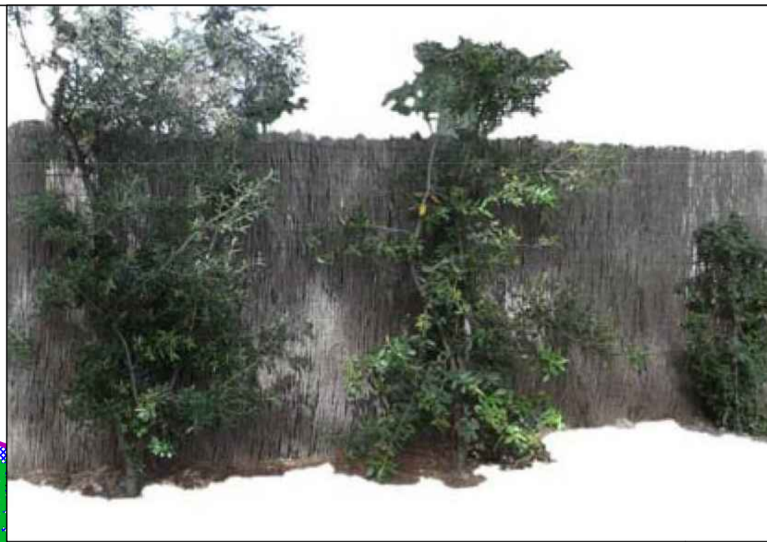
Recinzione schermata con Rhamnus alaternus e Cistus sp. Myrtus Communis